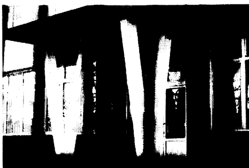
Rad Državne agencije za istrage i zaštitu (SIPA) u Regionalnom uredu u Banjoj Luci danas je privremeno spriječen. Međutim, način i okolnosti koje su dovele do takvog razvoja događaja je obavljen nizom nelogičnosti i velikim manjkom informacija.