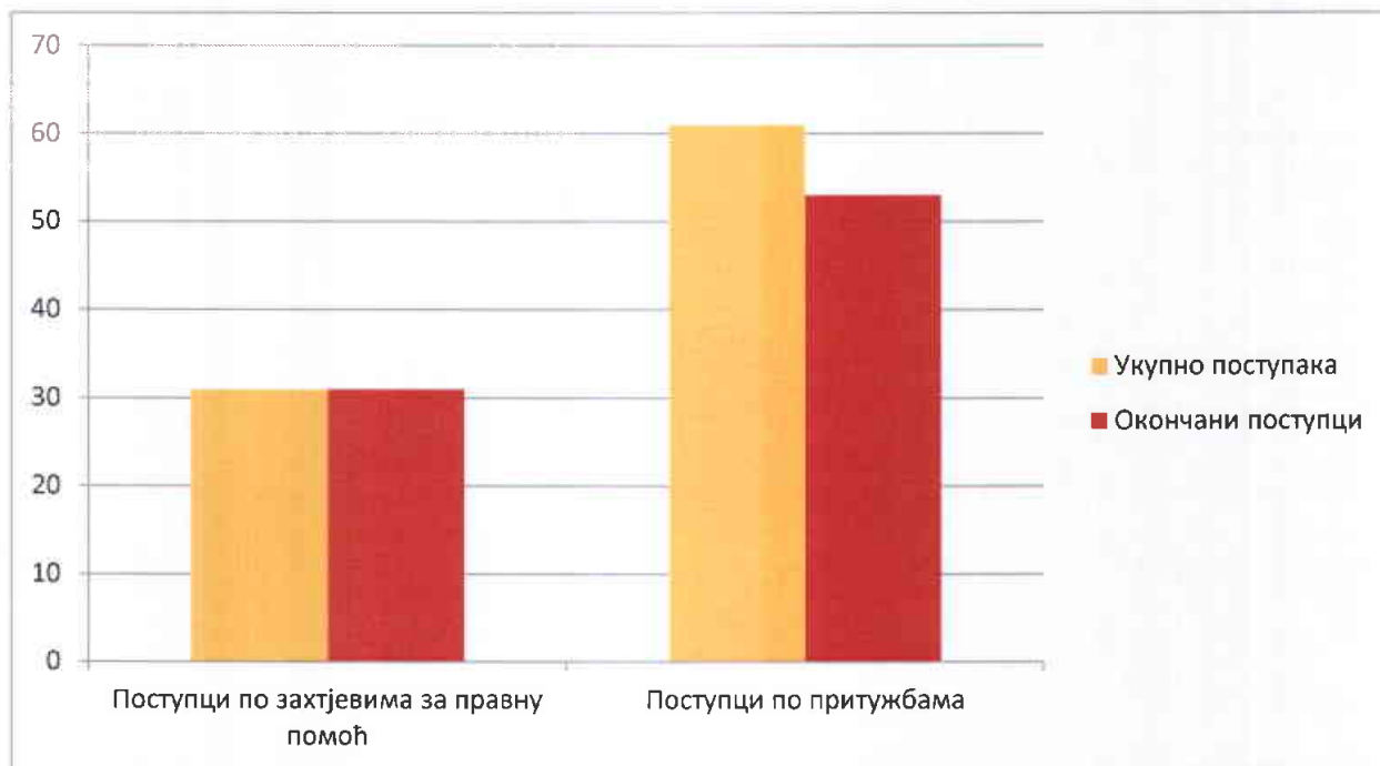
Табела 2. Преглед окончаних поступака у 2019. години

Дакле, од укупно 92 покренута поступка у Канцеларији војног повјереника у току 2019. године, њих 84 је окончано, док се у осам предмета поступак и даље води, како је то приказано у Табели број 3.