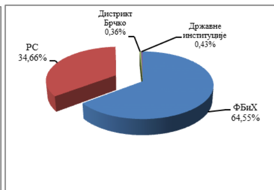
Графикон 2. % учешћа према извршеној алокацији обавеза у сервисираним обавезама

*Остали кредитори: Европска комисија, OFID(OPEC) Fond, Саудијски фонд, Кореја Exim Bank, UniCreditBank Austria, Raiffeisen bank, KFW, SEB, IFAD, ABN Amro, Влада Јапана, Bawag, Влада Шпаније, ERSTE bank и Кувајтски фонд.