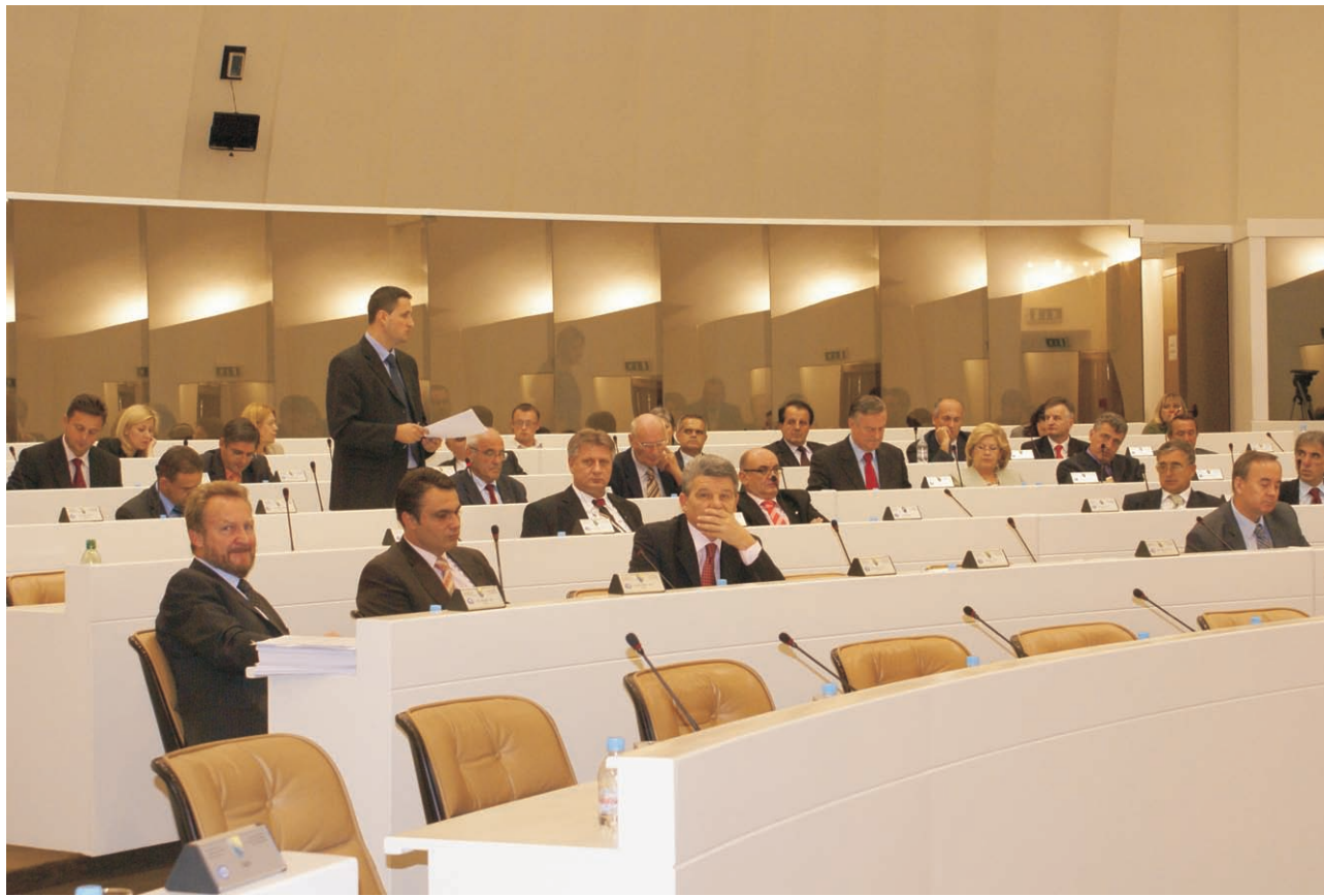
Sjednica Zastupničkog doma Parlamentarne skupštine Bosne i Hercegovine