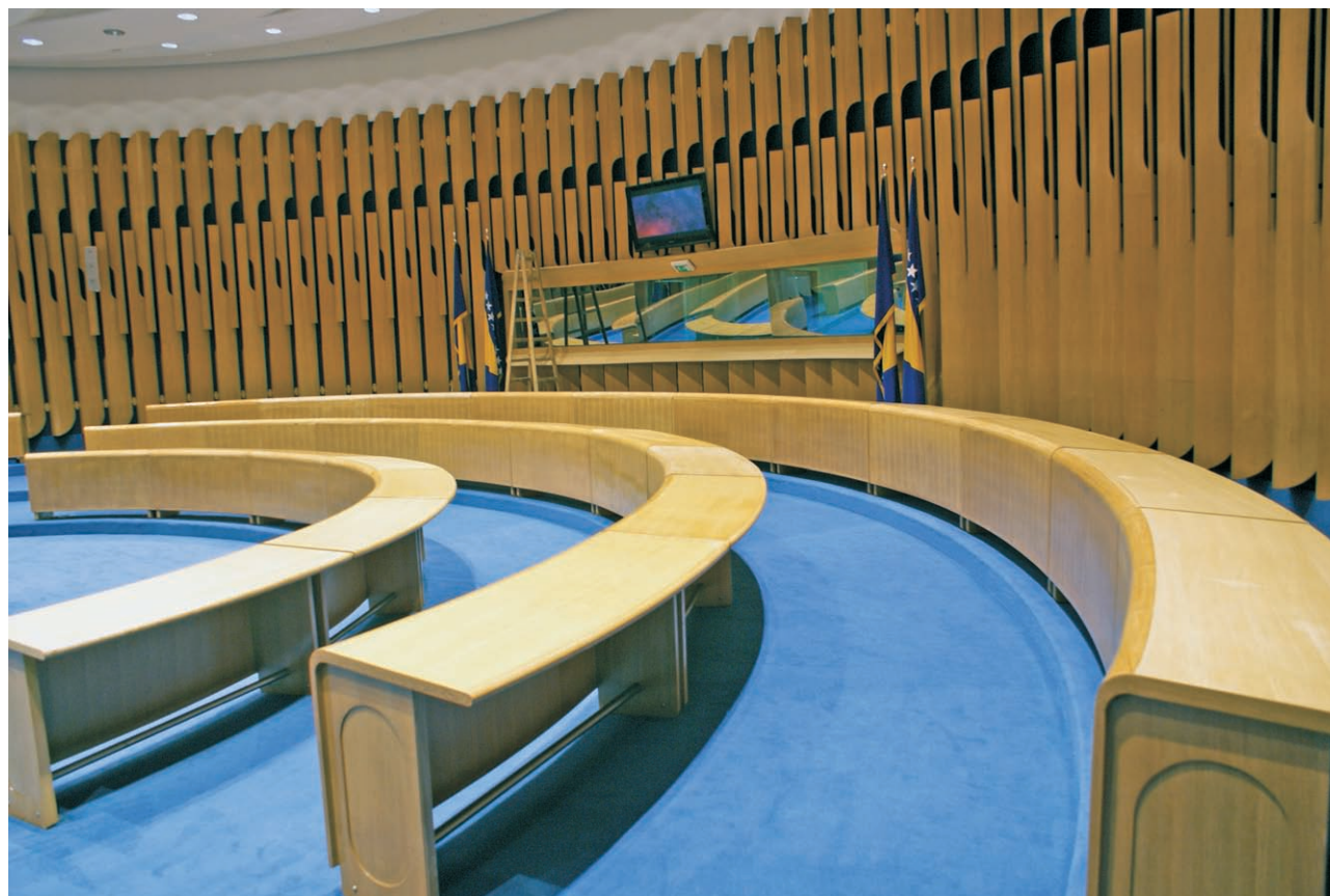
Detalj iz Plave dvorane