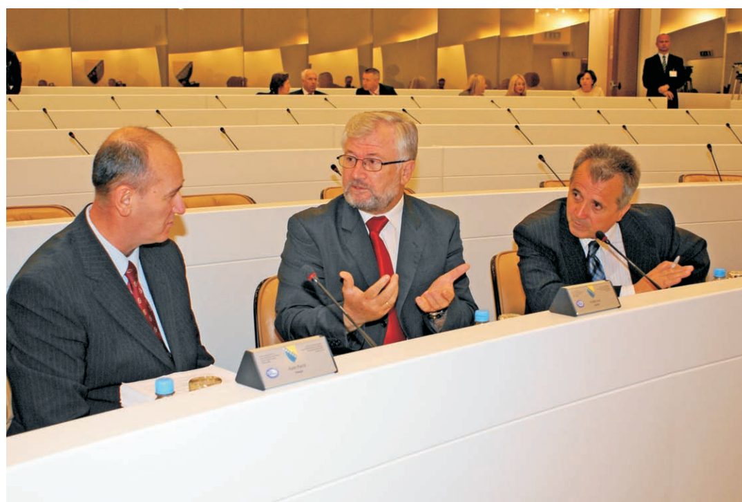
Sjednica Doma naroda