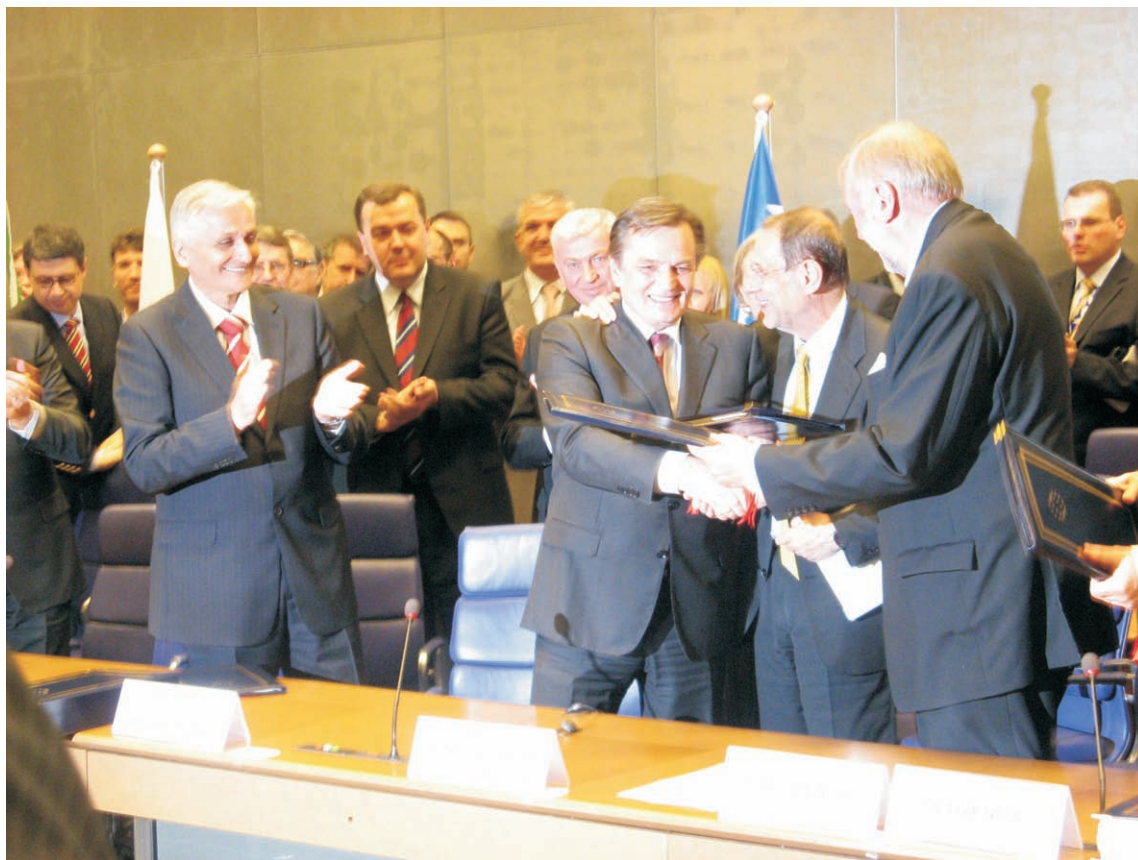
Sa potpisivanja sporazuma u Luxemburgu

Bosna i Hercegovina potpisala je Sporazum o stabilizaciji i pridruživanju s Evropskom unijom 16. juna 2008. godine u Luksemburgu. Ovim potpisom Bosna i Hercegovina stupila je u prvi ugovorni odnos s Evropskom unijom. U ime naše zemlje ugovor je potpisao Nikola Špirić, predsjedavajući Vijeća ministara BiH, dok su Evropsku uniju predstavljali; evropski komesar za proširenje Olli Rehn i ministar vanjskih poslova Slovenije i predsjedavajući EU Dimitrij Rupel. Dokument sadrži 1.300 stranica, a građanima BiH donijet će konkretnu korist i promovirat će reforme koji će generirati ekonomski rast i otvaranje novih radnih mjesta.