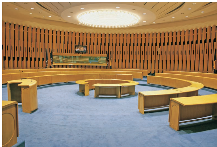
Изглед обновљене Плаве сале

Системи расвјете који су инсталирани у сали дозвољавају могућност селективног укључења и регулације ради прилагођавања за ТВ снимања. Вертикално освјетљење има снагу 1000 luxа а ради квалитетних ТВ преноса догађаја из Плаве сале инсталирана је квалитетна кабловска мрежа.