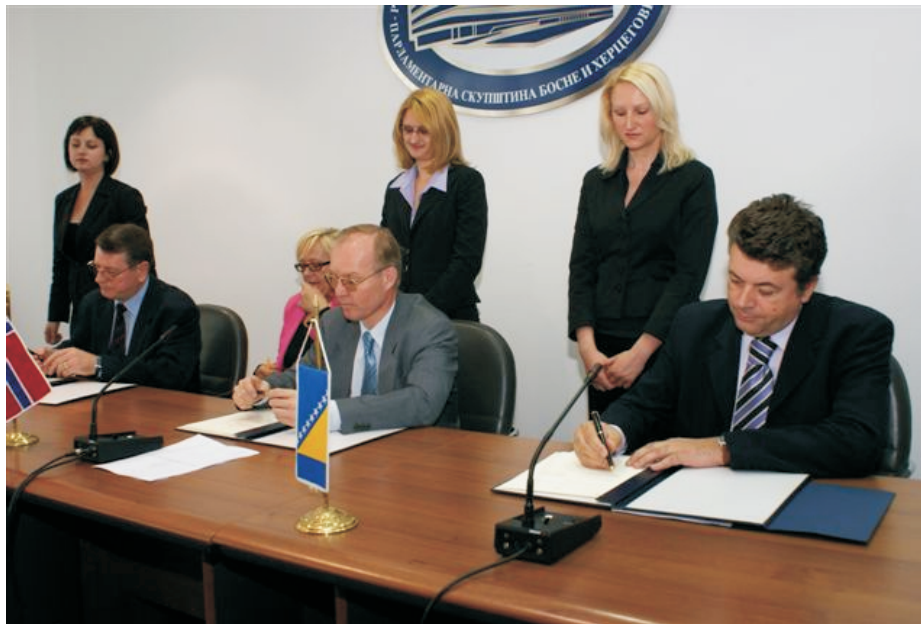
Свечани потпис споразума

метара, од тога око 4.000 камене фасаде и око 3.000 стаклених површина. Коначан изглед зграде требало би да буде сличан недавно обновљеној Згради пријатељства између Грчке и БиХ, која се налази у близини. Радови би требало да буду завршени до краја 2008. године.