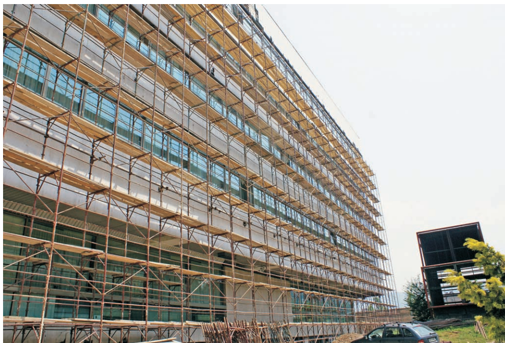
Радови на фасади зграде ПСБиХ

Презентација интранета одржана је 30. јуна у Бијелој сали. Једна од завршних иницијатива ЛСП-а односила се на Одјел писарнице, али је на одређен начин релевантна и за остале запослене у ПСБиХ, како би помогли у аутоматизацији рада писарнице и припремили терен за успостављање система електронског управљања документима. ЛСП је обезбиједио неопходну опрему и помогао у развоју модела примјене система управљања документима преко интранета.