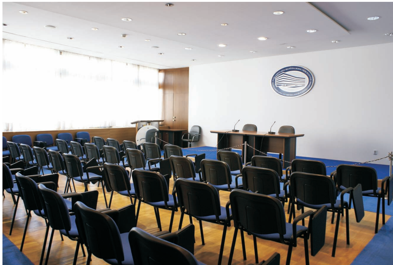
Sala za press konferencije

Sala za press konferencije nalazi se na drugom katu zgrade PSBiH. Otvorena je 2003. godine i raspolaže s približno 50 mjesta. Namijenjena je predstavljanju aktualnih događanja u PSBiH. K tomu, namijenjena je održavanju sastanaka članova povjerenstava te sastanaka s posjetiteljima.