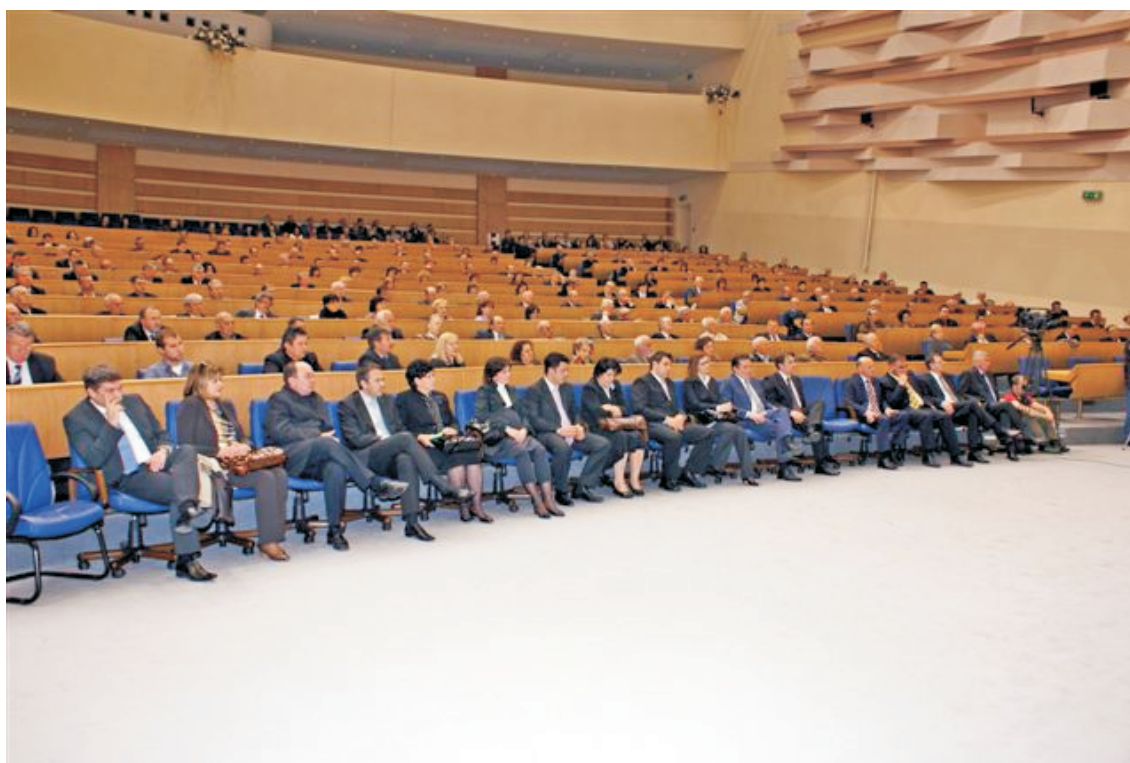
Komemorativna sjednica održana je u Velikoj sali

Šefik Džaferović istakao je da je on jedna od najznačajnijih figura bosanskohercegovačkog parlamentarnog života uopće. U svom izlaganju posebno je naglasio da je Čampara studiozno pristupio Dejtonskom mirovnom sporazumu, a posebno Aneksu IV., odnosno Ustavu BiH.