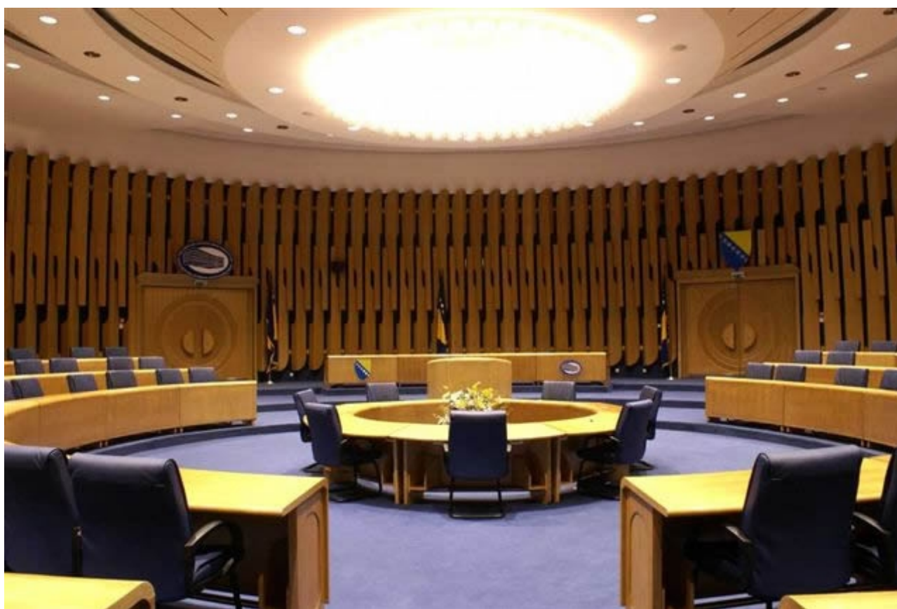
Успостављен аудио-видео streaming из Плаве сале

У току је набавка активне мрежне опреме, након чега ће послови инсталације и пуштања локалне мреже били завршени. ИТ сектор је ангажован и у дигитализацији Писарнице, додјелјивања овлашћења за приступ на сајтове на Microsoft Shared Point Portalu. Планирано је пружање подршке и организовање обуке за кориснике интранет портала. Након набавке опреме ИТ сектор је успоставио аудио-видео streaming из Плаве сале за директан пренос сједница Дома народа.