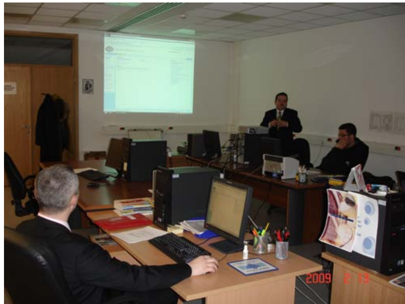
Обука чланова Колегијума Секретаријата

Рад Писарнице ПСБиХ у протекла два мјесеца везан је за дигитализацију, која је у завршној фази. Реализована је обука особља и чланова Колегијума Секретаријата. Свакодневно се побољшава примјена интранета. За сада се ради на два колосијека мануелно и дигитално, што ће трајати до краја године. Можемо очекивати да почне примјена Закона о електронском потпису и печату, чиме би се потпуно приступило пројекту дигитализације. Важно је напоменути да је цијели процес реализован уз помоћ ОЕБС-а.