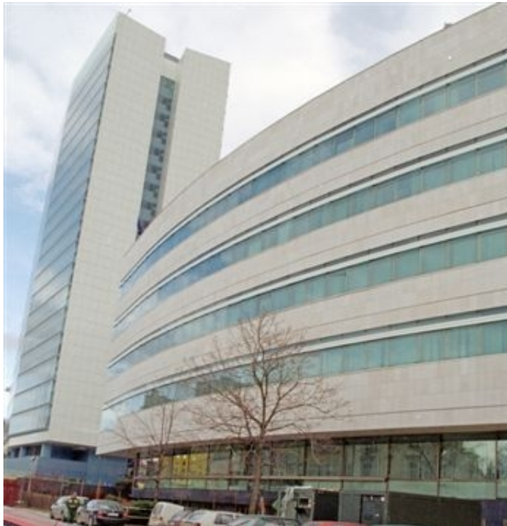
Izgled nove fasade

"Prezadovoljan sam obavljenim poslom i nadam se da će suradnja dviju zemalja biti nastavljena jačanjem međuparlamentarnih odnosa i drugih oblika suradnje", rekao je veleposlanik Braathu.