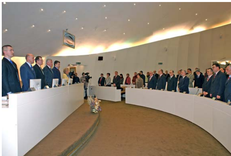
Zajednička sjednica PSBiH