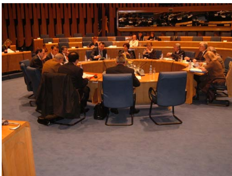
Članovi Zajedničkog povjerenstva podnijet će izvješće

Članovi Zajedničkog povjerenstva podnijet će izvješće o detaljima obavljenih posjeta i predložiti nekoliko zaključaka s ciljem poboljšanja rada spomenutih institucija i korištenja tehničke i materijalne pomoći iz raspoloživih fondova i programa. Situacija u obje ustanove ocijenjena je primjerenom.