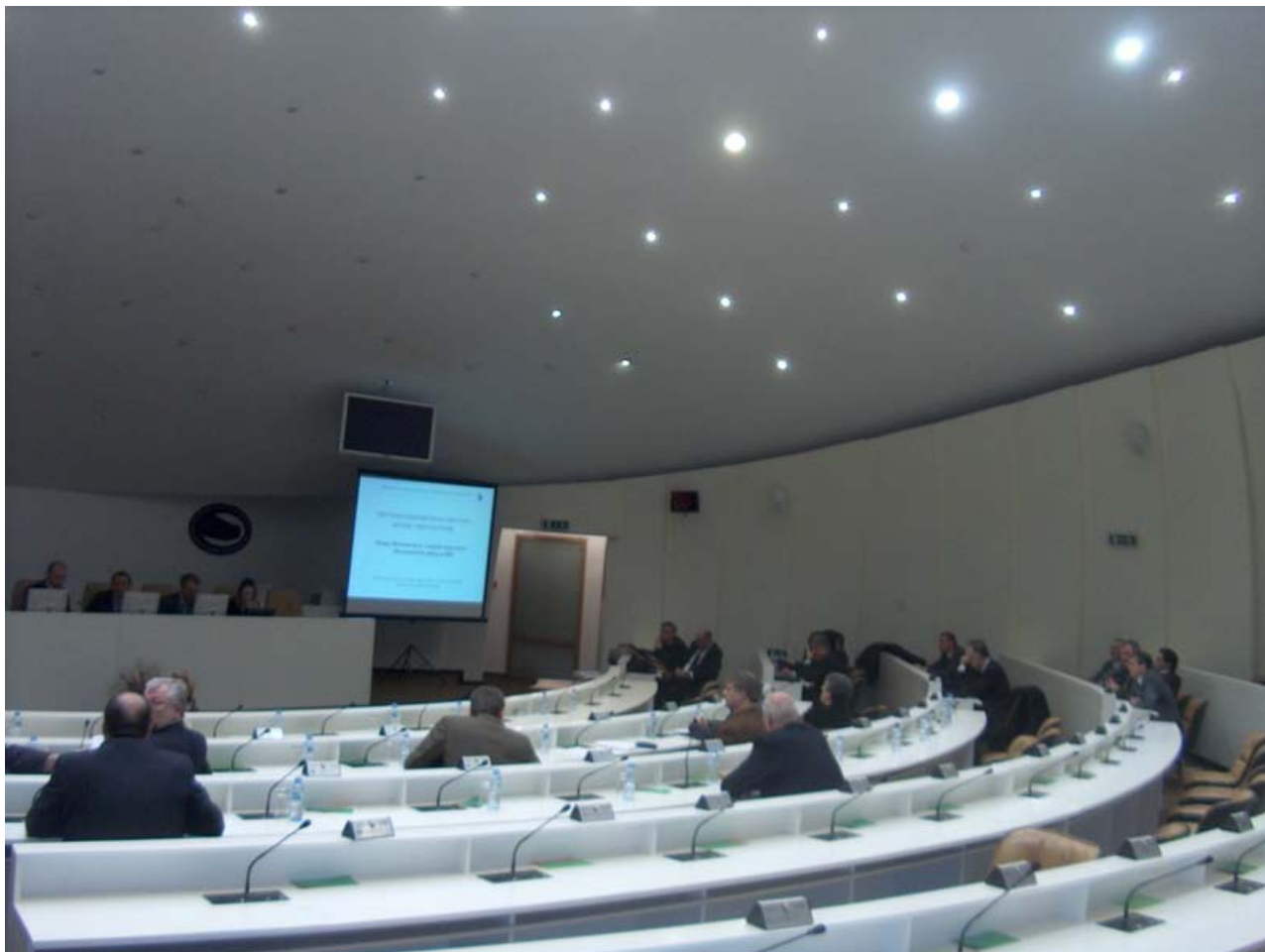
Prezentacija u Bijeloj sali

Prezentatori su bili Ministarstvo vanjske trgovine i ekonomskih odnosa BiH, Državna regulatorna komisija za električnu energiju, Regulatorna komisija za električnu energiju Federacije BiH, Regulatorna komisija za energetiku Republike Srpske, Elektroprijenos-Elektroprenos BiH, Nezavisni operator sistema u BiH, Elektroprivreda BiH, Elektroprivreda Republike Srpske, Javno preduzeće Elektroprivreda HZHB Mostar, te USAID/REAP - Projekt regulatorne i energetske pomoći.