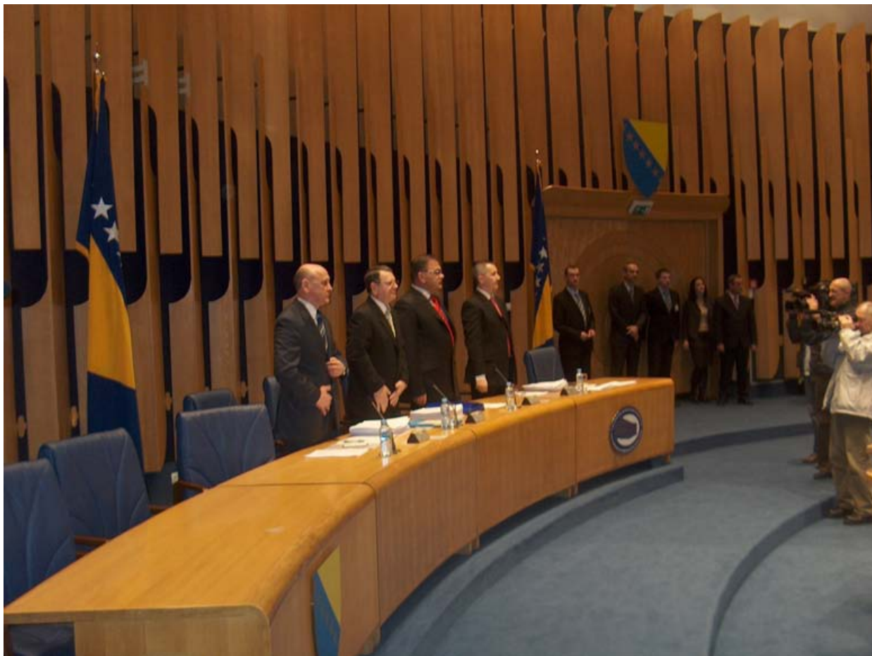
Dom naroda održao prvu sjednicu u Plavoj sali