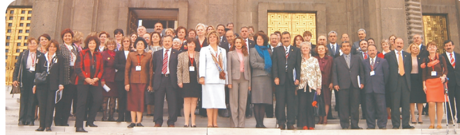
Учесници годиšnjeg sastanka IEPFPD-a u Ankari (April 2004. godine) na kojem je učešće uzela i bh. parlamentarna Grupa za populaciju i razvoj.

Од досадашњих активности Групе вриједно је споменути: одржавања конференција за новинаре поводом Свјетског популационог дана (11.7.04/05) и Дана борбе против HIV/AIDS (1.11.04); организовање Јавног саслушања посвећеног тешкој болести HIV/AIDS-у (20.5.2005); активности које су довеле до усвајања Отавског документа (акциони план Каирске декларације) у оба дома ПСБиХ; инсистирање на испуњавању формалних услова за апликацију БиХ према Глобалном фонду УН-а за средства потребна за борбу против HIV/AIDS-а и ТБЦ-а; обилазак НВО у пет бх. градова и сагледавање стања у којем раде и