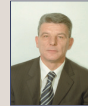
Џаферовић Шефик, Први замјеник