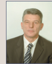
Džaferović Šefik, Prvi zamjenik