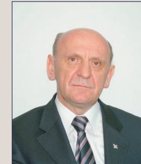
Sulejman Tihić drugi zamjenik predsjedavajućeg