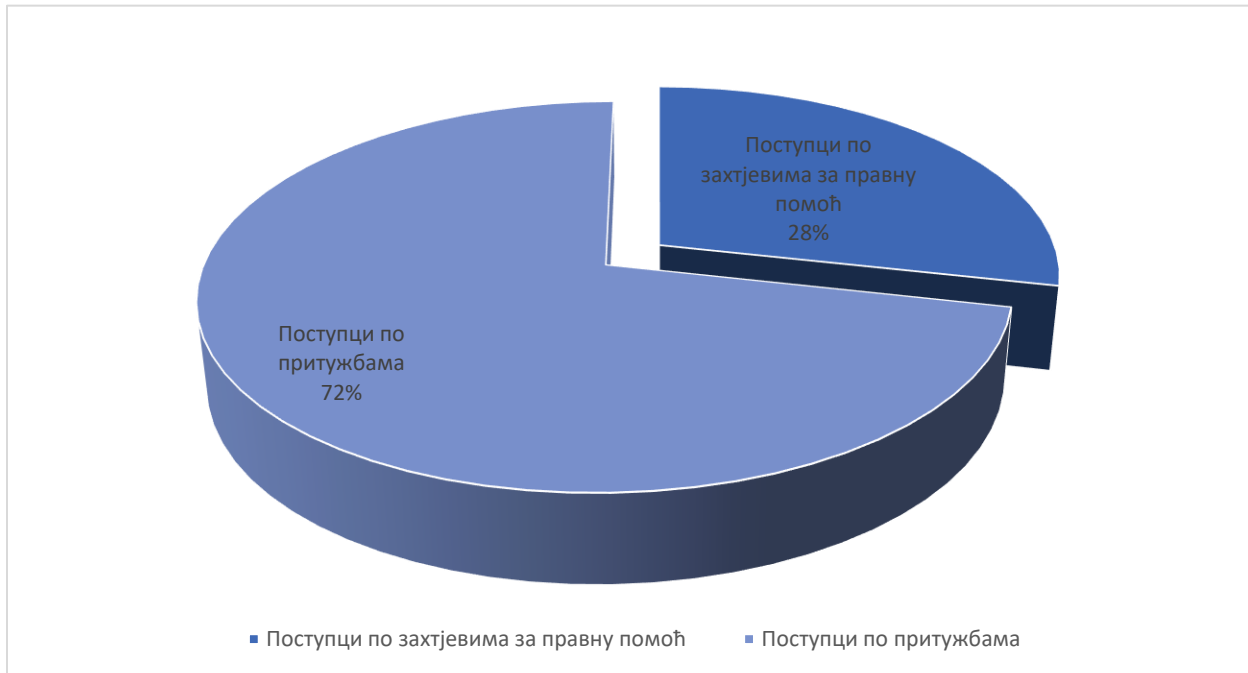
Табела 1. Преглед поступака вођених у Канцеларији војног повјереника током 2020. године

Преглед поступака вођених у Канцеларији војног повјереника током 2020. године дат је у Табели број 1.