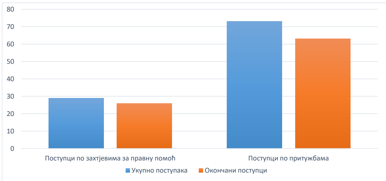
Табела 2. Преглед окончаних поступака у 2020. години

У извјештајном периоду поступци по притужбама окончани су у 63 предмета, по захтјевима за пружање правне помоћи окончано је 26 поступака. Преглед окончаних поступака по областима дајемо у Табели број 2.