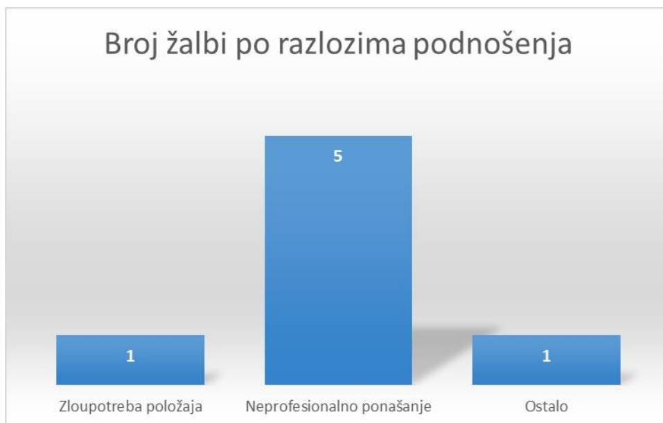
ГРАФИКОН бр. 4 (ДКПТ)

Разлози за подношење жалби углавном се односе на непримјерено и непрофесионално понашање полицијских службеника те на непримјерену комуникацију са грађанима.